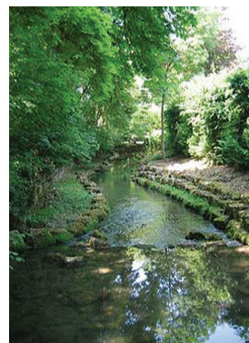
Le Petit Vair