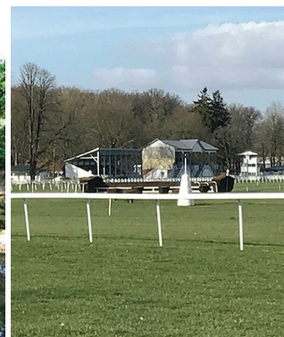
L'hippodrome de Vittel