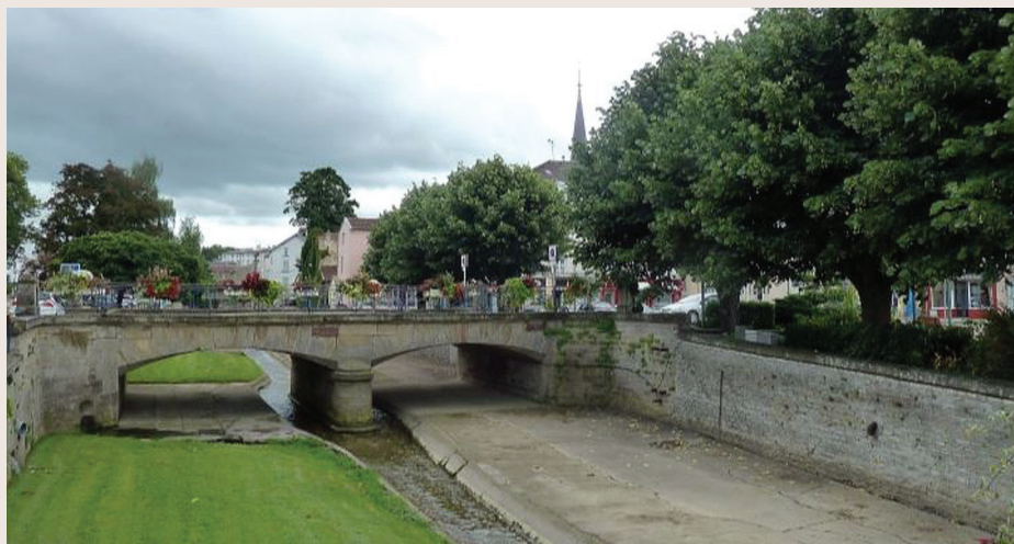
Le Petit Vair à Vittel