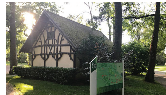
Parc de Vittel

Hôtels, gîtes, chambres d'hôtes, meublés... : renseignements dans les offices de tourisme de Vittel et Contrexéville